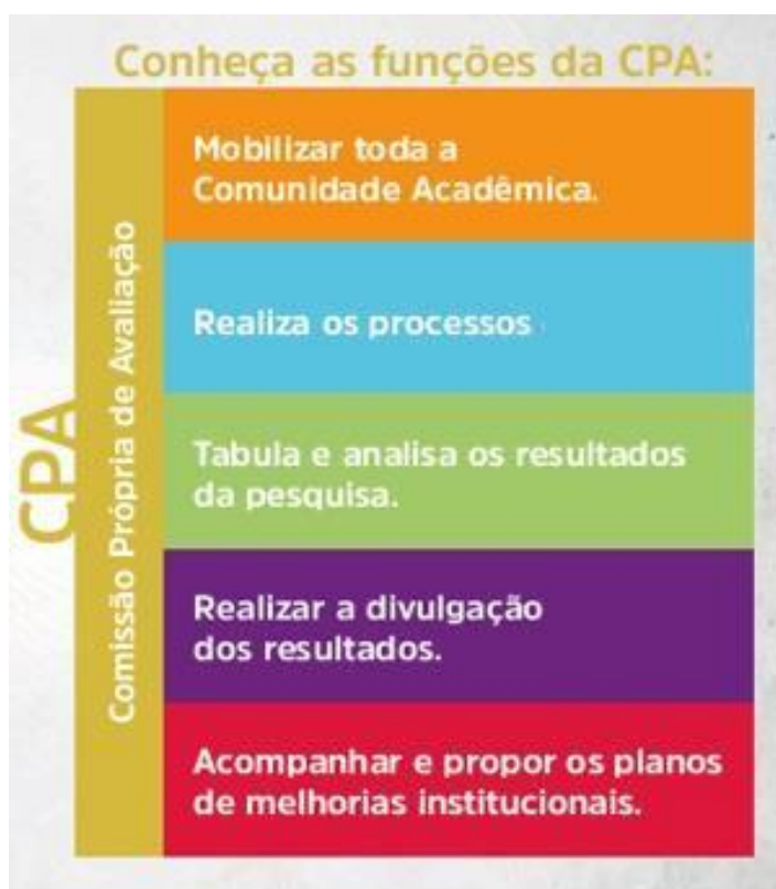
Figura 3 – Funções CPA