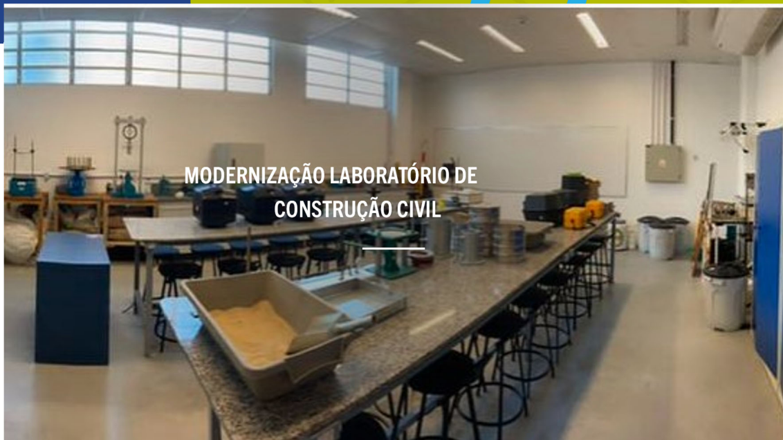
MODERNIZAÇÃO LABORATÓRIO DE CONSTRUÇÃO CIVIL